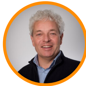
GORRIT-JAN BLONK STICHTING ALS NL