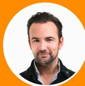
GERARD EKDOM AMBASSADEUR