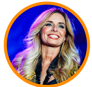
CANDY DULFER AMBASSADEUR